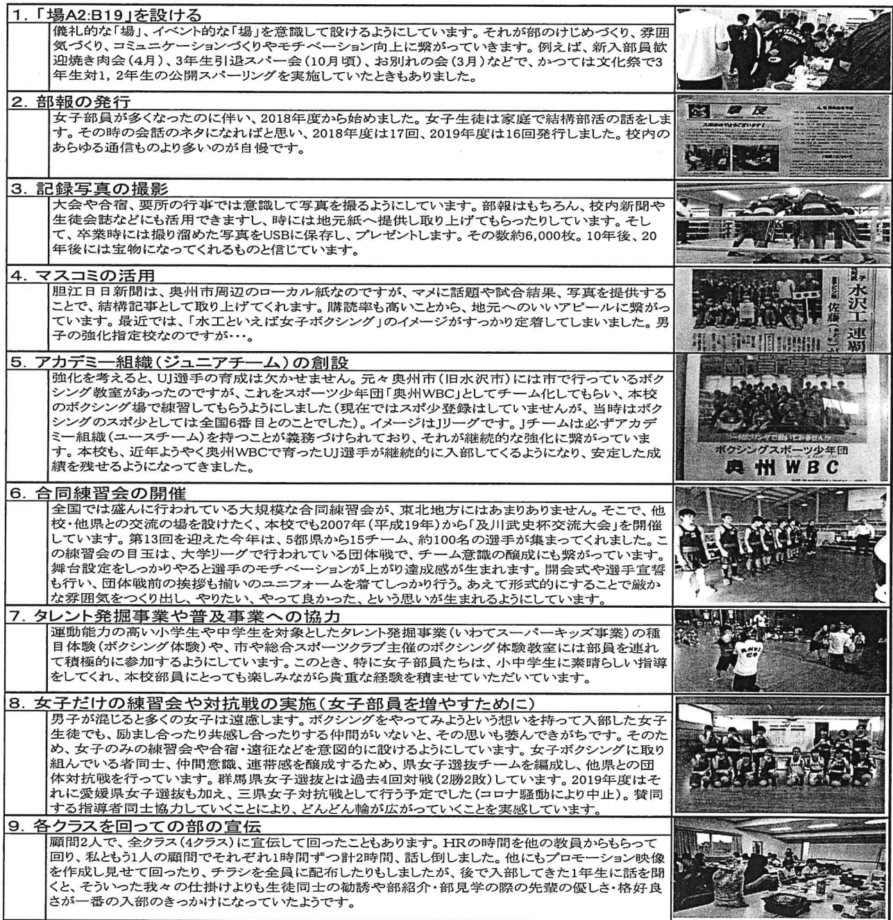
表-4 具体的な取り組み例

なお、本校ボクシング部（男子）が強化指定校に指定されてからの13年間の全国大会入賞者数は男子12名、女子19名を数えます（表-3）。本県の強化指定校の延長基準が「インターハイか国体における入賞数が12年間で4回以上」となっていることを考えると、一定の競技成績を収められているのではないかと思っています。その他、具体的な取り組み例の一覧を表-4にまとめました。