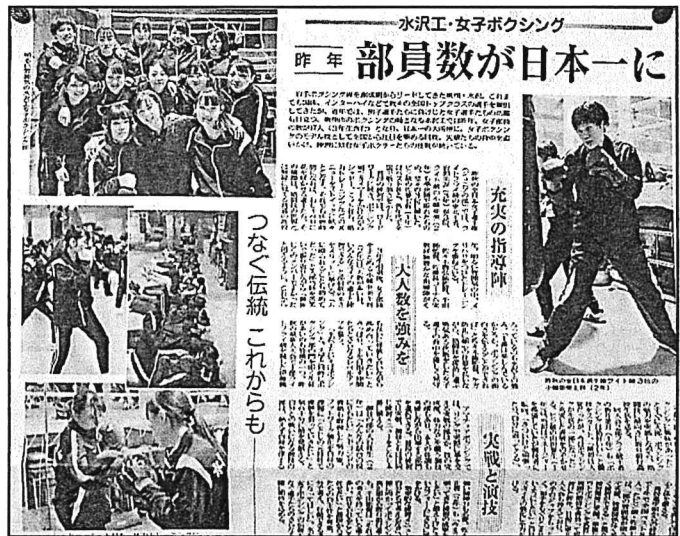
写真-1 1)

本稿は、部員確保を図りつつ、普及と強化を目標に、本校および本県専門部で取り組んでいることを事例として紹介します。